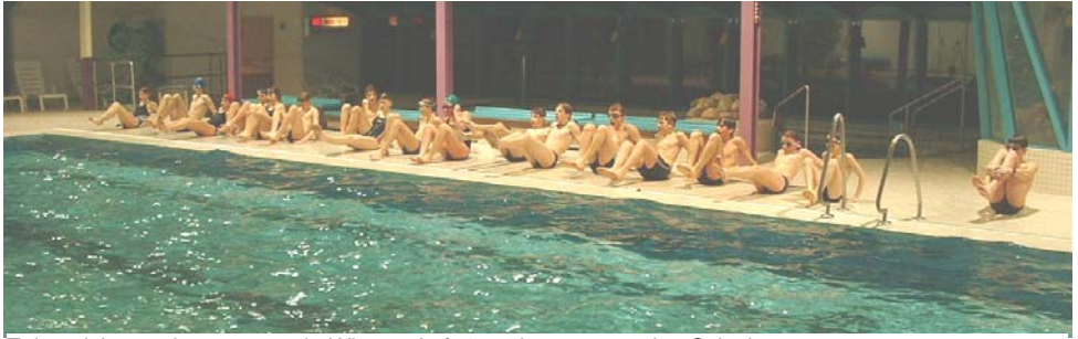
Talentsichtung Januar 2003 in Wingst: Aufwärmübungen vor den Schwimmtests