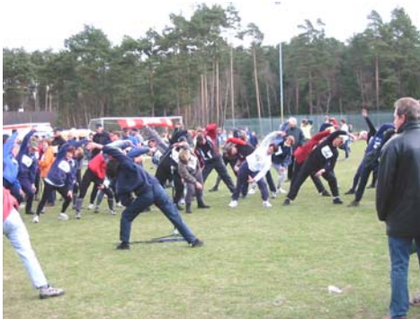
Die Walker bei Dehnübungen vor den Start

Der 10-Kilometer Hauptlauf wurde durch den diesjährigen Wasa-Lauf-