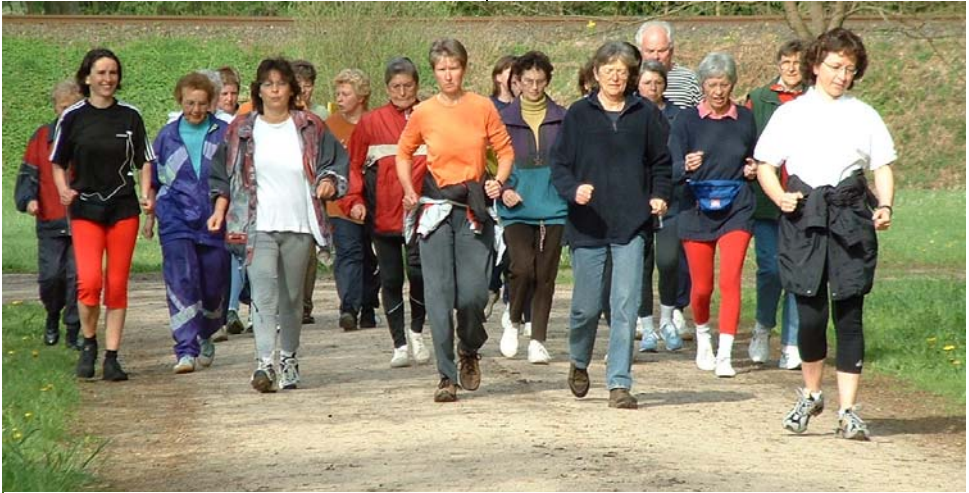
Die Walkinggruppe beim Training

Nachdem mich 3 junge Herren aus der Vereinsleitung überredet hatten eine Walkinggruppe ins Leben zu rufen, ging es also los. An einem Donnerstag im April, 9:00 Uhr war Start zur ersten Walkingrunde. Bis dahin mussten noch einige Fragen geklärt werden. Passt den Teilnehmern der Termin so gut wie mir? Von wo werden wir starten? Welchen Weg gehen wir? Bekommen wir Stick's (Walkingstöcke) vom Verein? usw. usw. Nachdem alles geklärt war und die Infoblätter unterwegs waren,