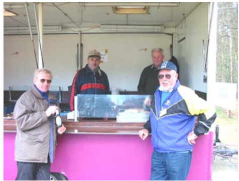
Vier Helfer des vielköpfigen Teams